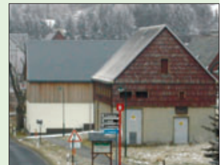
Alte Trafostation in Schellerhau vor der Umnutzung

Eine ehemalige Trafostation in der Ortslage Schellerhau wird zu Ausstellungsmöglichkeit für Oldtimer und Ausweitung der Materiallagerkapazität für die angrenzende Kfz-Werkstatt umgenutzt. Der Projektantrag wurde am 24.04.2008 eingereicht, dem Koordinierungskreis im ILE-Gebiet Silbernes Erzgebirge am 09.05.2008 vorgestellt und positiv bewertet. Auf Grund der zentrale Ortslage ist das Objekt für die Präsentation von Oldtimern gut geeignet und eine Bereicherung für das Ortsbild. Das Dachgeschoss ist zur Nutzung als Werkstattlager für Kundenaufträge vorgesehen. Der Umbau und damit die Erweiterung des KFZ-Betriebes sollen nachhaltig zu einer Neukundengewinnung und Umsatzsteigerung führen. Es werden Arbeitsplätze erhalten und perspektivisch weitere geschaffen. Nach ausführlicher Bearbeitung und Prüfung wurde das Projekt, wie oben beschrieben, im Oktober 2008 bewilligt. Die Realisierung der Maßnahme ist für Frühjahr/Sommer 2009 vorgesehen.