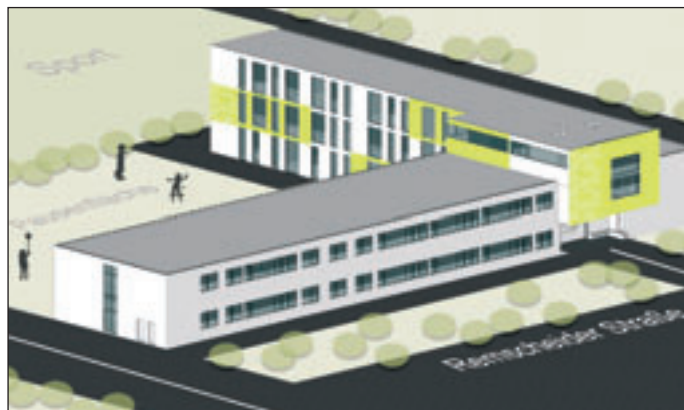
Modell der neuen Schule zur Lernförderung Pirna

Groß war die Freude im Pirnaer Landratsamt, als am 20.04.2009 gleich zwei Schulen des Landkreises die Bescheide für die Sanierung ihrer Gebäude erhielten. „Für den Landkreis als Träger der Schulen ist es ein großer Erfolg, dass sich in naher Zukunft die Lehr- und Lernbedingungen an gleich zwei Schulen verbessern.“, sagte Landrat Michael Geisler.