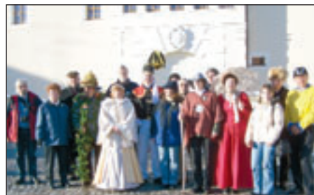
Vertreter der Gästeführer in typischen Kostümen vor Schloss Freudenstein in Freiberg.

Direktvermarkter regionaler Produkte stellen sich vor – Unter der Schirmherrschaft der Tourismusgemeinschaft „Silbernes Erzgebirge“ nun schon zur Tradition geworden, finden die jährlichen Gästeführertreffen zu speziellen Themen, zum Kennen lernen neuer Angebote und Attraktionen statt. Ständen im vorigen Jahr die Wellness- und Gesundheitsangebote auf der Tagesordnung, so galt das Thema in diesem Jahr den Produkten der Direktvermarkter unserer Region. So stellten u. a. die Bäckerei Bären-