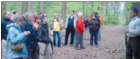
TourismusProfis Exkursion „Nationalpark live“ zum Brand

Stetig vielfältigere Angebote und ein steigender Wettbewerbsdruck machen Qualität zum alles entscheidenden Wettbewerbsfaktor.