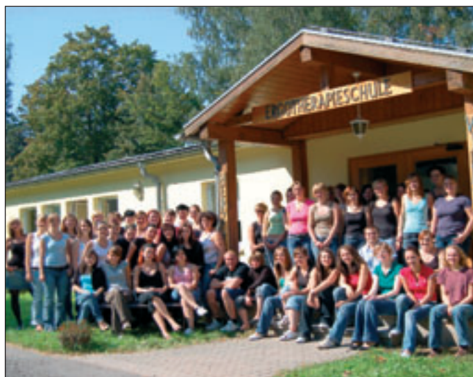
Schule für Ergotherapie

2008 besuchten schon über 50 Kinder das Camp. 12 Tage inklusive Vollverpflegung kosten 180 Euro. Eine Anmeldung ist über die Klinik in Zscheckwitz unter 035206 / 5-5305 oder per Mail an marion.schmutz@klinik-bavaria.de möglich. Das Camp wird durchgeführt vom 13.7. bis 24.7.2009 und vom 27.7. bis 7.8.2009.