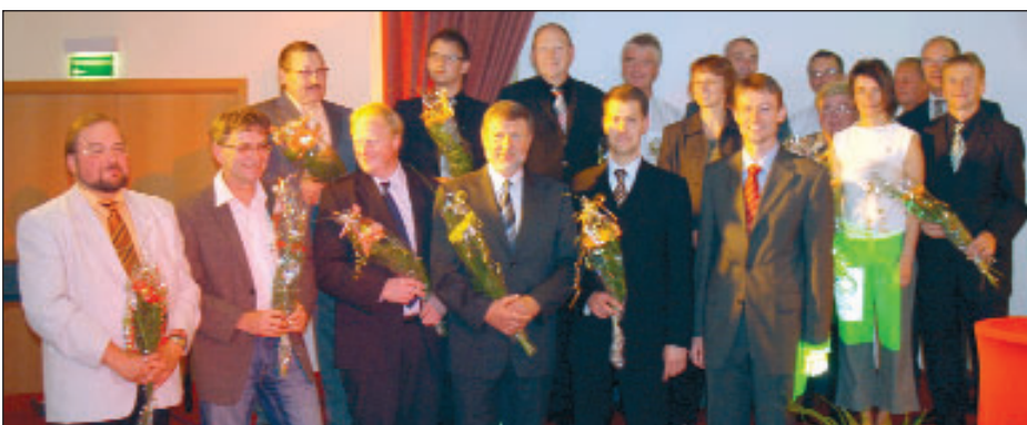
Das Präsidium des KSB mit Ehrengast, Kultusminister Prof. Dr. Roland Wölller (7. von rechts) • Im Foto oben: Der Präsident des Kreissportbundes Sächsische Schweiz-Osterzgebirge, Béla Bélafi.

ging eine wichtige Etappe zu Ende, in der über viele Monate um Inhalte und Positionen gerungen wurde. Mit rund 300 Sportvereinen und über 35000 Mitgliedern ist die größte Bürgervereinigung im Kreis Sächsische Schweiz-Osterzgebirge entstanden. Unter den Gästen in Freital waren Bundes- und Kommunalpolitiker, Vertreter der Wirtschaft, des Landessportbundes und der Sportvereine anwesend. Die beiden bisherigen Präsidenten Roland Matthes und Béla Bélafi gaben noch einmal einen kurzen Rückblick zur Sportgeschichte ihrer Kreissportbünde. Nun gilt es die Stärken beider Sportorganisationen zusammenzuführen, um den Sport weiter zu voranzubringen. Der neue Kultusminister, Prof. Dr. Roland Wölller, zugleich Sportminister, bestätigte in seinem Grußwort die Wichtigkeit der Bündelung aller sportlichen Belange im neuen KSB. Der Landrat des neuen Landkreises, Michael Geisler, versprach, dass es bei der künftigen Sportförderung keine Abstriche geben wird.