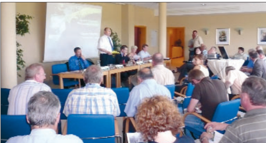
Mitgliederversammlung des Tourismusverbandes im Juni 2008 im Hotel „Rathener Hof“ in Struppen

Tourismusverband Sächsische Schweiz Bahnhofstraße 21 • 01796 Pirna Tel.: 03501-470147 • Telefax: 03501-470148 info@saechsische-schweiz.de www.saechsische-schweiz.de