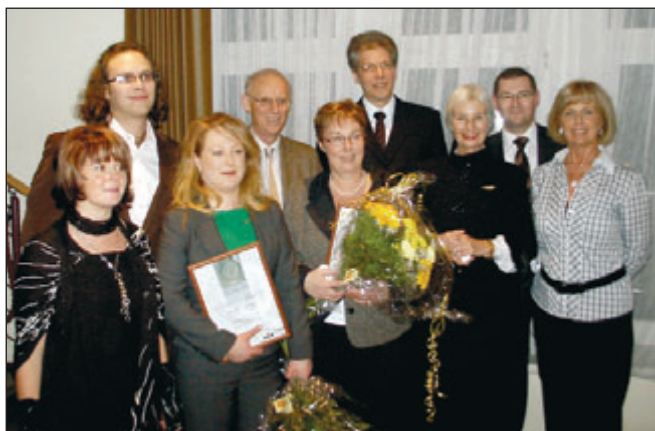
Die Sieger vom Vorjahr: Hotel „Lindenhof“ Bad Schandau, Restaurant „Goldener Löwe“ Lauenstein, Pension „Ostrauer Höhe“ Bad Schandau

Alle Unternehmen der Hotellerie und Gastronomie sind wieder aufgerufen, ihr Unternehmen testen zu lassen und zu zeigen, in welchen Qualitätsstandard unsere Region aufgestellt ist. So wird bereits zum vierten Mal der Wettbewerb „Pokal der Gastlichkeit“ für Hotels, Restaurants und Pensionen im Landkreis Sächsische Schweiz-Osterzgebirge ausgeschrieben. Zum zweiten Mal werden dieses Jahr drei Pokale vergeben. Das beste Hotel, die gastfreundlichste Pension und das beste Restaurant, dürfen dann ein Jahr lang ihr Haus mit einer der drei Trophäen schmücken. Das Landratsamt Sächsische Schweiz-Osterzgebirge, der DEHOGA Regionalverband Sächsische Schweiz und der Tourismusverband Silbernes Erzgebirge unterstützen dieses Projekt. Gemeinsam mit dem Freiburger Brauhaus und Margonbrunnen Lichtenau wird der Wettbewerb auf die Beine gestellt. Die Tester, die ab dem 01.07.2009 die Teilnehmer überprüfen, werden besonders auf