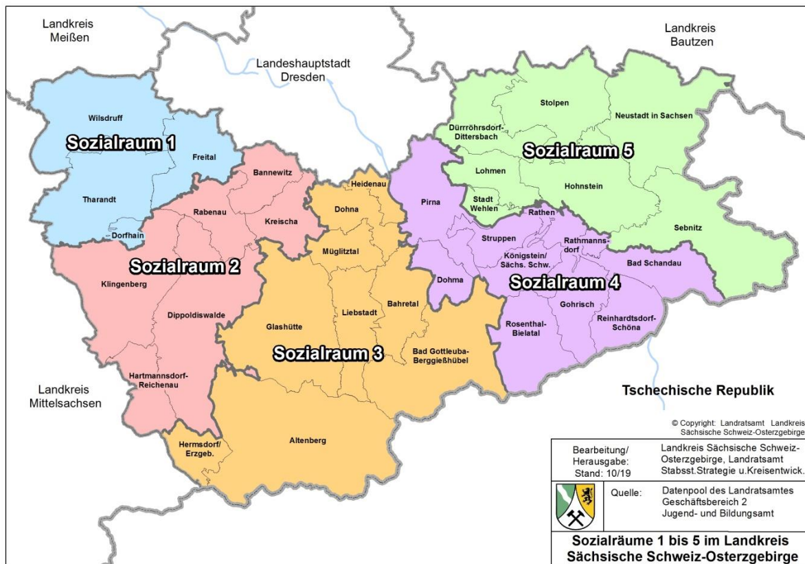
Abbildung 2 Sozialräume 1 bis 5 im Landkreis Sächsische Schweiz-Osterzgebirge (Stand 04/2021)

Im Ergebnis beschloss der Kreistag die nachfolgende Neudefinition der fünf Sozialräume: