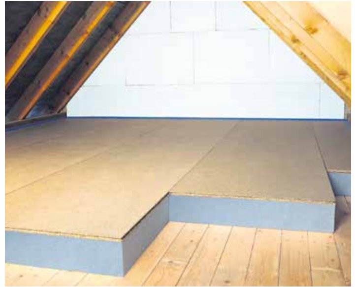
Eine professionelle Wärmedämmung verhindert, dass über den Dachboden kostspielige Heizenergie ungenutzt entweicht.

Kellerdecke. Mit dem Fachbetriebsfinder unter www.brillux.de/zuhause lassen sich erfahrene Ansprechpartner vor Ort suchen, zudem gibt es dort mehr Informationen zu Fördermitteln sowie Tipps, wie sich das Eigenheim für den nächsten Winter fit machen lässt. Von der Dämmung profitieren die Bewohner noch in weiterer Hinsicht: Denn ein ganzjährig angenehmes und gesundes Raumklima trägt zu mehr Wohlbefinden bei. (djd)