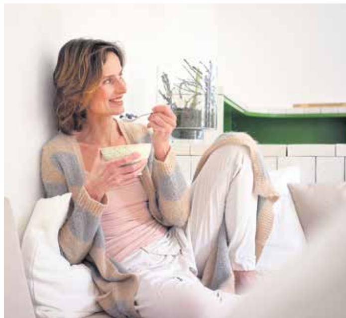
Eine ausgewogene Ernährung und kleine Ruhepausen im Alltag unterstützen das Immunsystem.

Der komplexe Aufbau der Darmschleimhaut mit über 1.000 verschiedenen Mikroorganismen und Bakterienstämmen ist eine erste Barriere gegenüber krankmachenden Keimen. Dauerhafter Stress und psychische Belastungen wie Ängste oder Sorgen beeinflussen unsere Darmgesundheit negativ. Daher sollte man möglichst auf ausreichende Ruhephasen im Alltag achten. Generell tut auch Bewegung, am besten an der frischen Luft, dem Darm gut. Und weil beim Essen jeder Verdauungsvorgang seine Zeit in Anspruch nimmt, sollten Snacks zwischendurch optimalerweise vermieden werden, um das Verdauungssystem nicht zu überlasten. Besser ist es, alle vier bis fünf Stunden eine ausreichende Portion zu essen. Calcium, das vor allem in Milch und Milchprodukten enthalten ist, trägt zu einer normalen Funktion der Verdauungsenzyme bei und kann somit auch unterstützend wirken. Auch Ballaststoffe und fermentierte Lebensmittel sind für den Darm besonders wertvoll. Daher sollte man regelmäßig Joghurt, Kefir oder Sauerkraut essen. Bananen und Leinsamen können ebenfalls die Darmflora unterstützen. (djd)