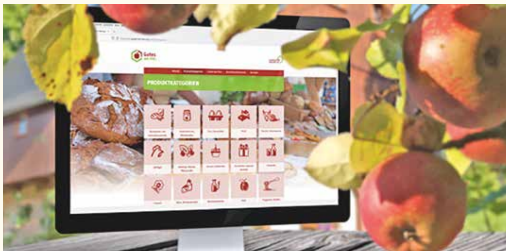
Die Einstiegsseite der Regionaldatenbank-Website ( www.gutes-von-hier.org ) mit einer Übersicht über die Produktgruppen und aktuellen Mitglieder. Zusätzlich ist hier die Verteilung der derzeit enthaltenen Einträge im Vergleich zum Vorjahr dargestellt.

keine Weltreise hinter sich haben, an Frische und Geschmack nicht zu toppen. Als Einstieg und Vorbereitung auf die Regiowoche gibt es Tipps und leckere Rezeptideen unter www.regionaufmschirm.de an die Hand. Weitere Inhalte sind außerdem auf Instagram @regionale.lebensmittel.sachsen zu entdecken.