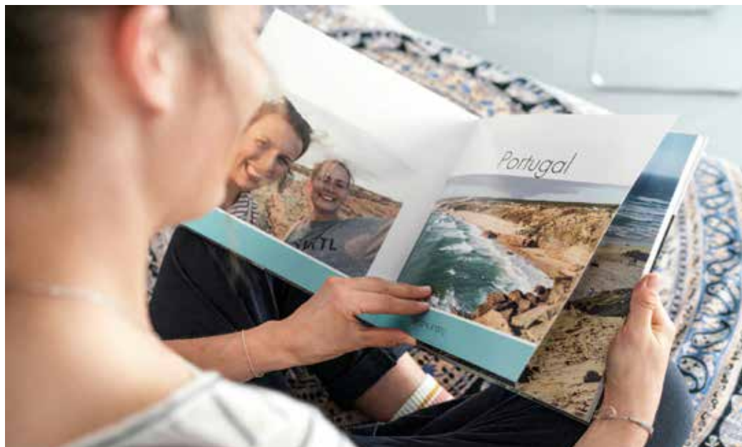
Fotobücher halten die Erinnerung an schöne Reisedomente für immer wach.

Individuell gestaltete Fotobücher gehören zu den Klassikern, die bei jedem Durchblättern die Erinnerung an Traumreisen lebendig werden lassen. Zur Wahl stehen unterschiedlichste Formate, Einbände und Buchvorlagen, die aus jedem Band ein echtes Unikat machen. Praktisch sind etwa XL-Fotobücher mit einem individualisierten Schuber, hierbei ist die Hülle ein Blickfang und Schutz zugleich. Ob als Erinnerung für Mitreisende oder als Geschenk für liebe Menschen,