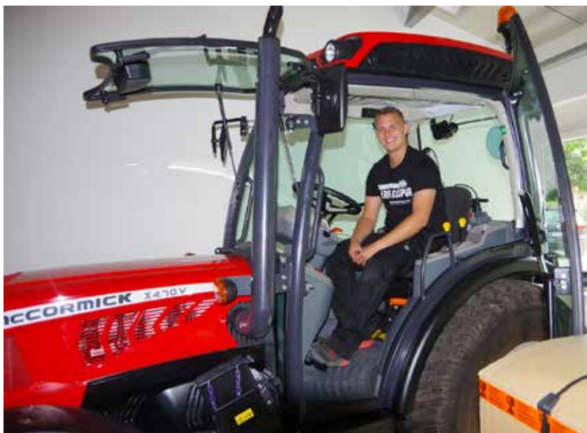
Schweres Gerät sicher beherrschen: Die Leidenschaft für Technik ist eine gute Voraussetzung für eine Ausbildung im Motorgeräte-Fachhandel.