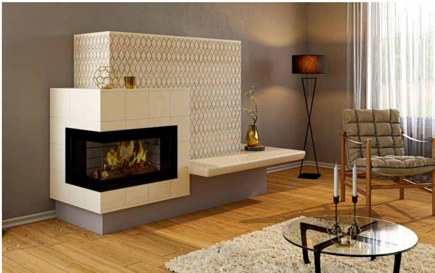
Eine Ofenmodernisierung entlastet die Umwelt und kann den Energieverbrauch nachhaltig senken.

Alte Holzfeuerstätten, die zwischen 1. Januar 1995 und 21. März 2010 in Betrieb gingen und die Vorgaben der aktuellen Verordnung zur Durchführung des Bundesimmissionsschutzgesetzes (BImSchV) nicht erfüllen, müssen bis zum 31. Dezember 2024 stillgelegt, nachgerüstet oder ausgetauscht werden. Das Typenschild gibt Auskunft, aus welchem Jahr die Feuerstätte stammt. Falls der Ofen kein Typenschild trägt, hilft eine Anfrage beim Hersteller. Wer die Bezeichnung seines Ofens kennt, kann auch eine Datenbank unter www.cert.hki-online.de nutzen. Zudem überprüft der