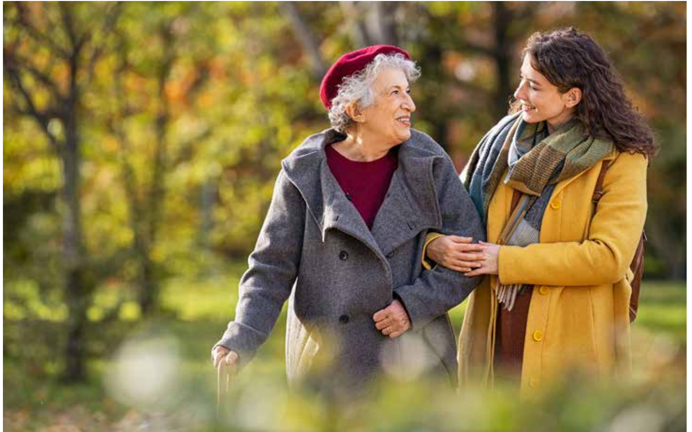
Wie will man des verstorbenen Ehemanns und Vaters gedenken? Erinnerungsdiamanten aus Asche oder Haaren beispielsweise sind ein unvergängliches und diskretes Erbstück und ein noch ungewöhnlicher Bereich der Bestattungskultur.

„Abschied und Trauer sind keine Tabuthemen mehr, das Ende wird wieder Teil unseres Lebens, immer häufiger beschäftigen sich alte wie junge Menschen auch öffentlich mit Themen wie Sterben und Tod“ - so heißt es im Editorial des „Sterbereports 2022“, der sich unter anderem ausführlich mit den Veränderungen im deutschen Bestattungswesen befasst. Besonders markant ist der Trend weg vom Sarg und hin zur Urne. 1960 entschieden sich noch gut 90 Prozent der Deutschen für eine Erdbestattung, nur zehn Prozent wählten die Feuerbestattung. 2020 lag das Verhältnis bei 24 zu 76 Prozent zugunsten der Feuerbestattung. Mit der Tendenz zur Urnenbestattung verbunden ist die wachsende Nachfrage nach alternativen und individuellen Bestattungsformen wie dem Friedwald, der Seebestattung oder dem Erinnerungsdiamanten.