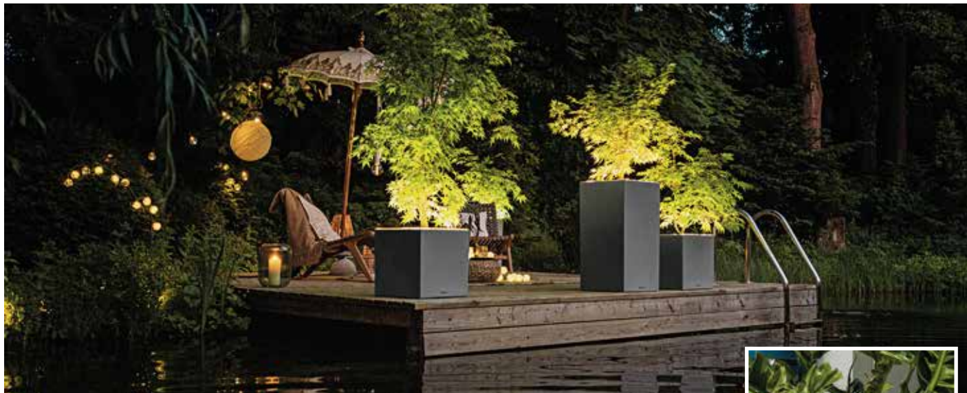
Pflanzgefäße mit integrierten LED Lichtbändern sorgen für diese fantastische Abendstimmung im Garten. Wer muss da noch in Urlaub fahren?

An lauen Abenden werden Garten, Terrasse und Balkon zum Outdoor-Wohnzimmer und Treffpunkt für Familie, Nachbarn und Freunde. Es wird gegrillt, gefeiert - oder bei einem kühlen Bier oder einem Aperol Spritz einfach nur gechillt. Viele Menschen haben dann das Gefühl, gar nicht mehr in Urlaub fahren zu müssen, „Staycation“ heißt das trendige Stichwort: Man bleibt zu Hause und kommt trotzdem in Ferienstimmung.