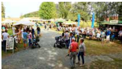
Bergwiesenfest in Königstein-Ebenheit

Auf dem Naturmarkt mit deutschen und tschechischen Anbietern werden kuli-