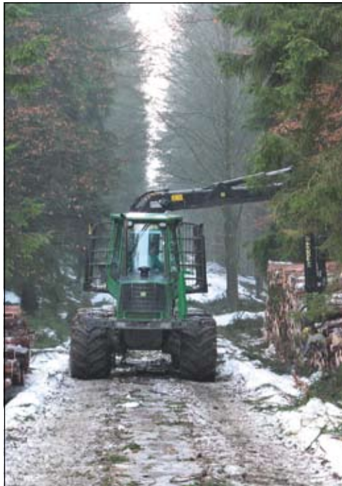
Einsatz von Forstspezialtechnik mit Boden schonenden Breitreifen.

Im Nationalpark gilt auf der überwiegenden Fläche das Prinzip „ Natur Natur sein lassen “. Das NLP-Programm sieht gleichzeitig auf einem Flächenanteil von 43 % Pflegemaßnahmen in nicht naturnahen Waldbeständen vor. Vor diesem Hintergrund finden im Zeitraum Januar bis März 2011 entlang des Unteren Affensteinweges, in zwei Beständen am Zeughausweg (Lehmhübelweg und Vorderer Naßschluchteweg) sowie im Bereich Hinterer Heideweg Holzeinschlagsmaßnahmen statt. Am Unteren Affensteinweg wird der Bereich zwischen Abzweig Jordan und Bloßstock gepflegt. Insgesamt fallen dabei über 2000m 3 Holz, die zu über 50 % mit Harvester eingeschlagen werden, an. Der Untere Affensteinweg und Teilstücken des Zeughausweges müssen für die Rückung des Holzes genutzt werden. Die erwarteten Wegeschäden werden unmittelbar nach Abtransport des Holzes behoben. Wanderer werden gebeten, sich in diesem Zeitraum auf zeitweise Wegesperrungen und schlechten Wegezustand einzustellen. Der Eingriff ist notwendig, um über 30 ha Wald im Sinne der Zielstellungen des Nationalparks zu entwickeln. Dazu zählt z. B. die Entnahme gebietsfremder Baumarten wie Lärche und Roteiche und die Förderung der heimischen Laubbäume durch entsprechende Auflichtung der Waldbestände, v. a. durch Entnahme der Baumart Fichte.