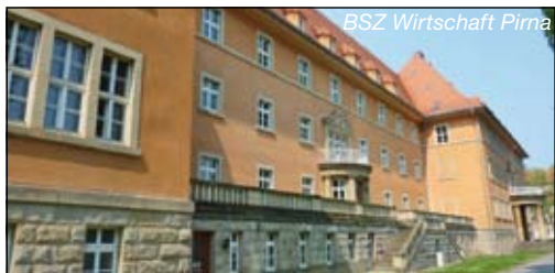
BSZ Wirtschaft Pirna